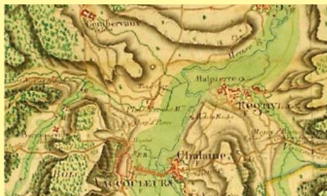
Environs de Vaucouleurs, selon les Naudin

représentations suivent cette tendance. La diversité des techniques de représentation illustre cette évolution. Les cartes perdent leur dimension « poétique » et « fantaisiste » pour devenir un support fiable, témoin de l'activité humaine que l'on peut ainsi mieux anticiper et maîtriser. La carte est un outil de gestion dont l'utilisation est encore d'actualité. Ainsi, par exemple, l'analyse des cartes anciennes est au cœur d'un programme d'études sur l'évolution du massif forestier mené par l'Institut National de Recherche Agronomique de Nancy.