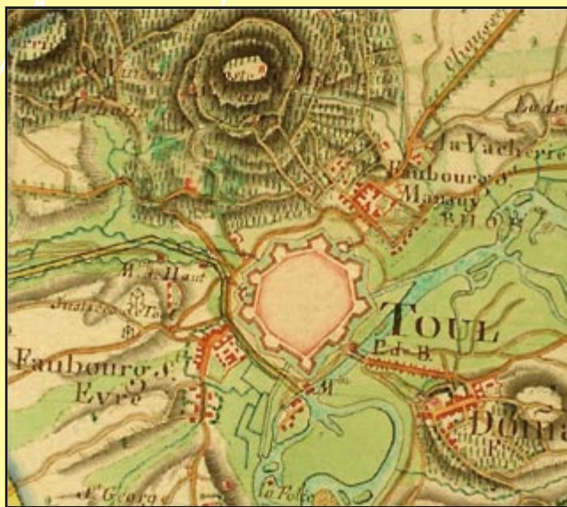
Carte des Naudin : Toul

Jean-Pierre MASSERET Président du Conseil Régional de Lorraine Sénateur de la Moselle