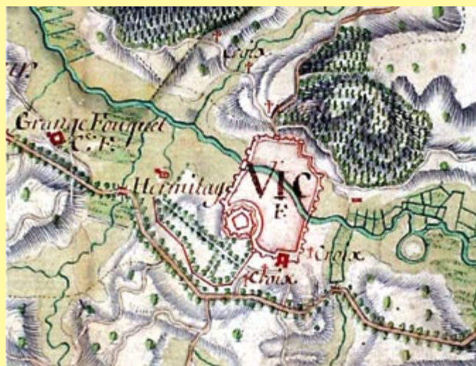
Carte des Naudin : environs de Vic-sur-Seille

Ces cartes ne doivent pas occulter l'existence de cartes aux ambitions plus modestes mais aux motivations nouvelles comme les cartes d'arpentage, de délimitation de propriétés, de gestion de bien qui se multiplient dans la seconde moitié du dix-huitième siècle. Pour reprendre l'analyse de Monsieur Jean-Pierre Husson, les représentations sont alors les témoins du passage « des droits attachés à des titres, à des droits référés, à des espaces ». Les procédés de